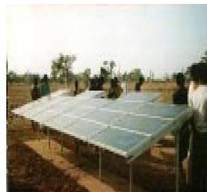
Modules photovoltaïques pour l'alimentation d'une pompe

Pour ceux qui sont à l'étranger, nous vous annonçons- que le bulletin ne sera plus envoyé par la poste étant donné qu'il peut être consulté désormais en version originale sur le site : http://rehred-haiti.net/membres/bme/synergie