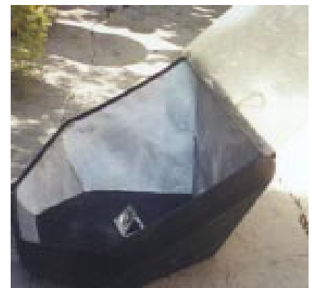
Modèle de Cuiseur solaire sans réflecteur externe

Ces cuiseurs pourraient diminuer grandement la consommation de bois et de charbon de bois comme carburant pour la cuisson mais leur utilisation demande des modifications importantes de la préparation des aliments et leur mode de cuisson. Ainsi ces cuiseurs ne peuvent être utilisés que le jour, lorsqu'il y a un bon ensoleillement. Les températures de cuissons sont relativement faibles