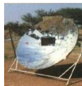
Cuisneur solaire parabolique

Mis à part certaines applications spécifiques (utilisation dans des camps de réfugiés, des centres de santé), les efforts pour introduire les cuiseurs solaires dans les sociétés traditionnelles ont été, la plupart du temps, peu réussis, il doivent maintenant être intégrés dans des lieux d'usages plus généralisés. Actuellement, les programmes d'utilisation de fours améliorés pour réduire la consommation de charbon de bois ou de bois de feu et l'utilisation de poêle au biogaz et au gaz