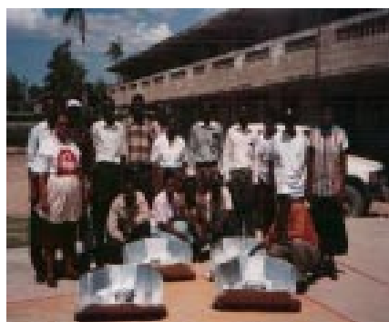
Séance de démonstration de cuiseur "Panel" à Lascahobas

Un message important à tirer des expériences de terrain c'est la participation des bénéficiaires dans l'acquisition des matériels et aussi dans la réalisation des séances de cuissons. A chaque atelier de formation les participants motivés apportent après consensus les provisions nécessaires à la préparation du repas de la journée. La participation des bénéficiaires tant au niveau des matériels que de la nourriture représente un élément important pour la suite du projet et pour l'avenir de la méthode de cuisson solaire en Haïti. Les initiateurs du programme ont aussi noté l'effet multiplicateur généré dans la population bénéficiaire. Plus d'une centaine de personnes ont été formées par le truchement d'autres personnes qui ont été elles-mêmes formées directement par le programme. Elles se sont même constituées en