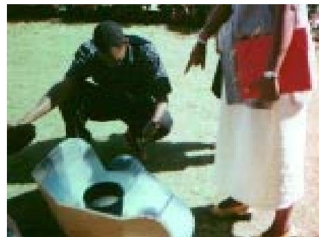
Cuisinière «panel» en opération

Le recours aux énergies renouvelables, en particulier l'énergie solaire, est de nature à permettre un développement sans risques c'est à dire durable. La protection de l'environnement n'est pas l'affaire d'un individu ni d'un gouvernement (nord ou sud) c'est l'affaire de tout le monde riche ou pauvre. La détérioration