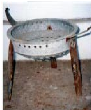
Réchaud traditionnel à trois pieds

En conclusion, il y a lieu de noter que l'expérience de diffusion des 10 000 réchauds Mirak a quand même permis des économies substantielles au niveau des utilisateurs. Les enquêtes menées sur le terrain ont révélé des économies de 4 à 5 gourdes par jour par ménage sur 13.5 gourdes normalement dépensés dans l'achat de charbon de bois. En considérant la quantité totale de réchauds diffusés cela constitue environ 500,000 dollars américains économisés par les familles par année au niveau du poste combustible. Ces calculs étant très conservateurs (on pense entre autres que les artisans ne rapportent pas la quantité totale des réchauds vendus en dehors des commandes officielles placées par le projet d'une part, et que les économies rapportées par les utilisateurs peuvent être plus élevées d'autre part), nous croyons que l'impact du projet en terme d'économie peut être plus élevé. Il est quand même dommage que le manque de fonds ait retardé le lancement de certaines activités qui étaient prévues dans le cadre du projet de Conservation et de Substitution d'Énergie dont l'activité de diffusion des foyers Mirak constitue seulement un volet. □