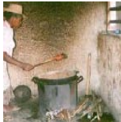
Fourneau à bois amélioré.

Les tests d'observation sur le terrain sont des essais permettant de connaître l'efficacité d'un R.A. dans le cadre d'une utilisation normale en situation réelle après avoir mesuré sa performance au