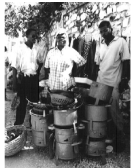
Vente de réchaud Mirak à P-au-P

Synergies se propose de travailler sur les problèmes liés à l'énergie et les solutions à y apporter. L'accent est mis sur le secteur des ménages et des petites entreprises, secteur qui consomme, sous forme de bois et de charbon de bois, la plus grande partie de l'énergie en Haïti. L'objectif est d'informer et de permettre aux institutions, organisations et entreprises de partager leurs expériences sur les questions énergétiques.