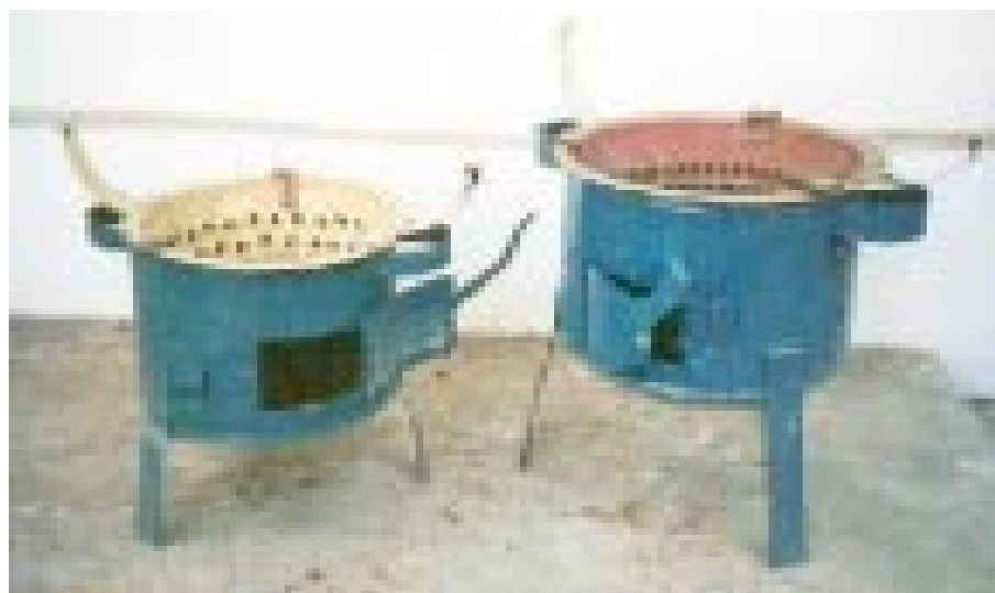
Réchaud Mirak (Version Modifiée).

En attendant que des dispositions soient prises pour la mise sur pied d'un programme de plus grande envergure, des efforts sont accomplis en vue de poursuivre l'activité pilote de diffusion des foyers améliorés dans les ménages et les cantines scolaires.