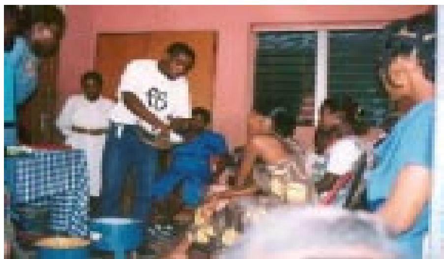
Démonstration du réchaud Mirak à un groupe de femmes.

Il existe trois raisons principales expliquant cette attitude.