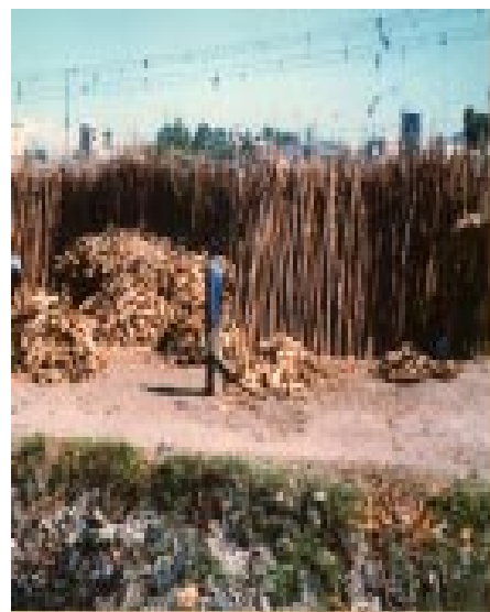
Poteaux tirés de jeunes arbres exposés pour la vente.

Synergies se propose de travailler sur les problèmes liés à l'énergie et les solutions à y apporter. L'accent est mis sur le secteur des ménages et des petites entreprises, secteur qui consomme, sous forme de bois et de charbon de bois, la plus grande partie de l'énergie en Haïti. L'objectif est d'informer et de permettre aux institutions, organisations et entreprises de partager leurs expériences sur les questions énergétiques.