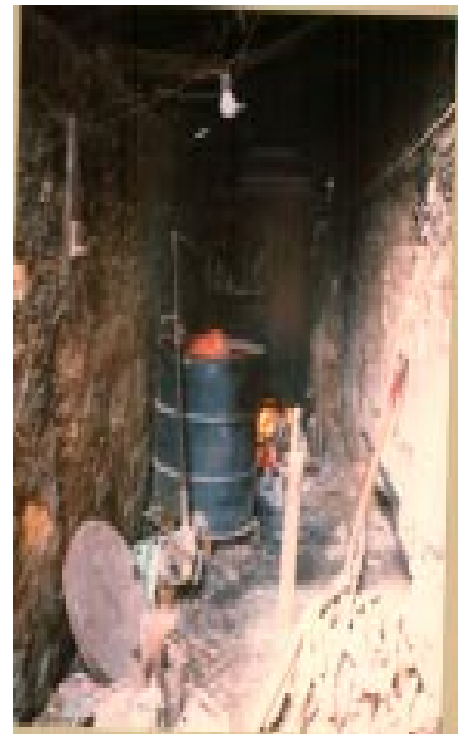
Système de chauffage de l'eau dans les dry-cleanings

Il existe en plus d'autres contraintes pratiques qui rendent difficile l'utilisation des équipements modernes. Les brûleurs diesel nécessitent une faible quantité d'électricité pour faire fonctionner les pompes et le système électronique d'allumage. Aucun boulanger ne voudrait voir s'arrêter son activité au milieu de la journée à cause du rationnement électrique.