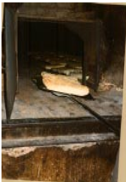
Four d'une boulangerie fonctionnant au bois