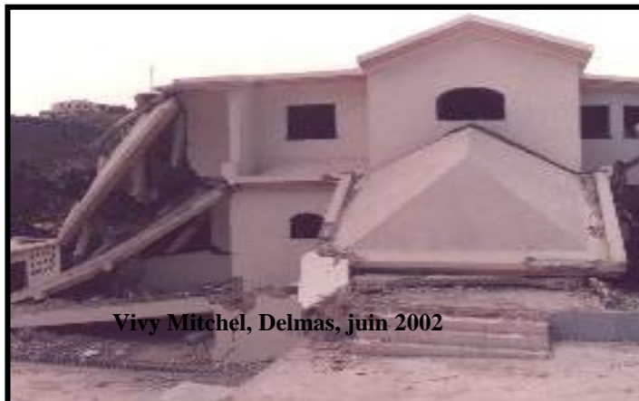
Vivy Mitchel, Delmas, juin 2002