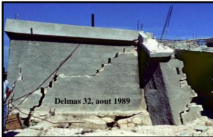
Delmas 32, aout 1989