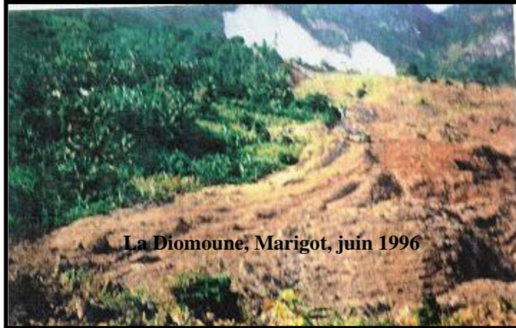
La Diomoune, Marigot, juin 1996